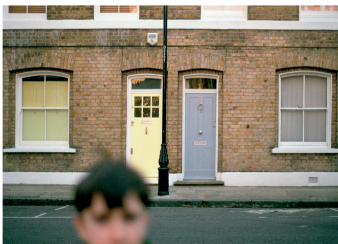
Elwin Street , 2011