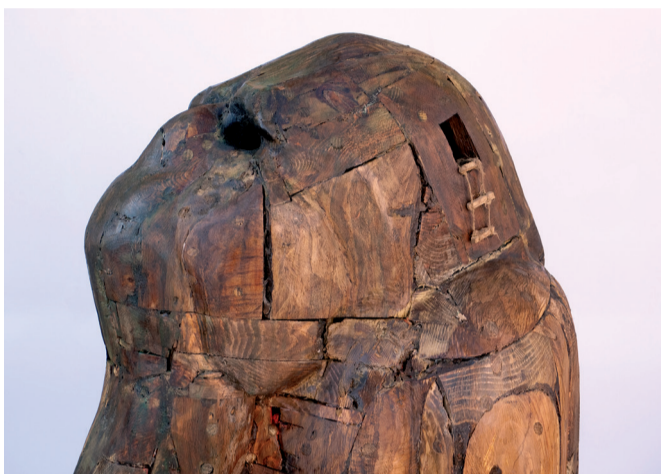
Escafandra (detall), 2013. Fusta reciclada. 197 x 80 x 72 cm