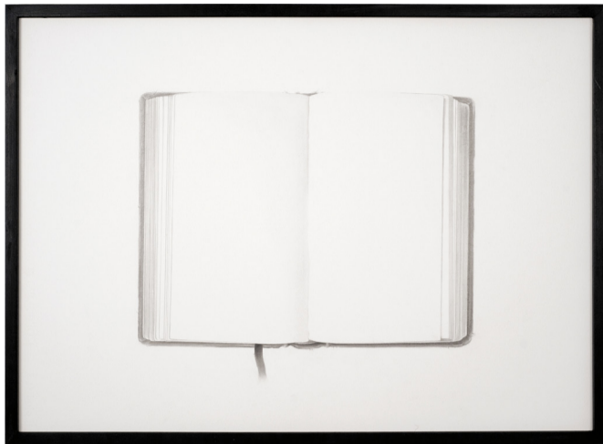
Lo negro y sus canciones , 2010. Grafit sobre paper. 52 x 72 cm