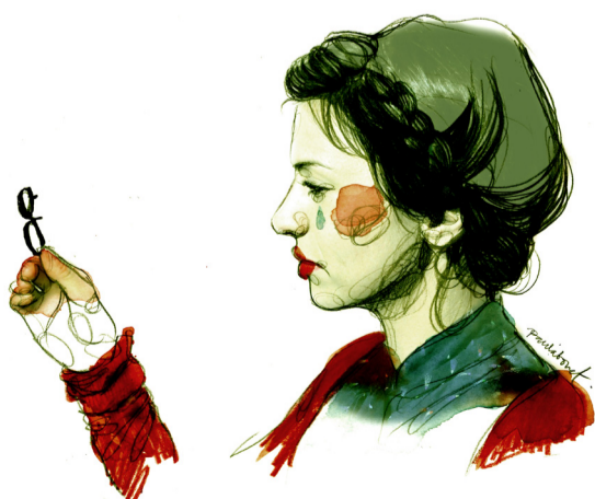
extraer de cada lágrima la letra G. maria leach