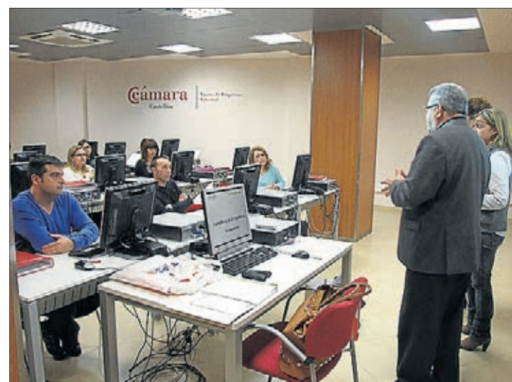
El regidor d'Economia va visitar un dels cursos formatius.

També per a enguany s'ha incrementat amb 10.000 euros la partida destinada a la subvenció per a la creació de noves empreses i, per a aquest exercici, la quantia total serà de 30.000 euros. Batalla ha recordat que, el 2013, es van crear 40 iniciatives empresarials, es va ubicar a Vila-real el Punt de Suport a l'Emprenedor del Pacte Ceràmic, un total de 13 empreses de nova creació van ser subvencionades amb 1.500 euros cadascuna i 2.000 en el cas de ser empreses innovadores i ha destacat l'èxit del programa Vilabeca "gràcies al qual molts joves tenen ara una activitat laboral o empresarial", ha conclòs l'edil. ■