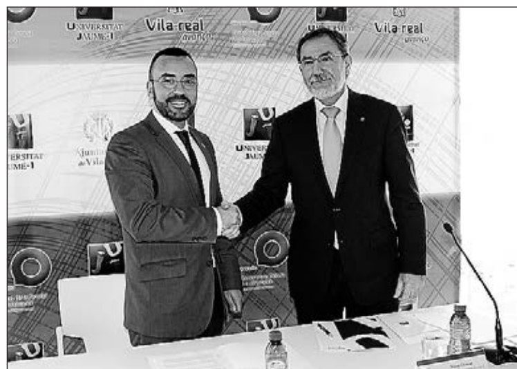
Amb aquest acord, augmenta la presència de l'UJI a la ciutat.