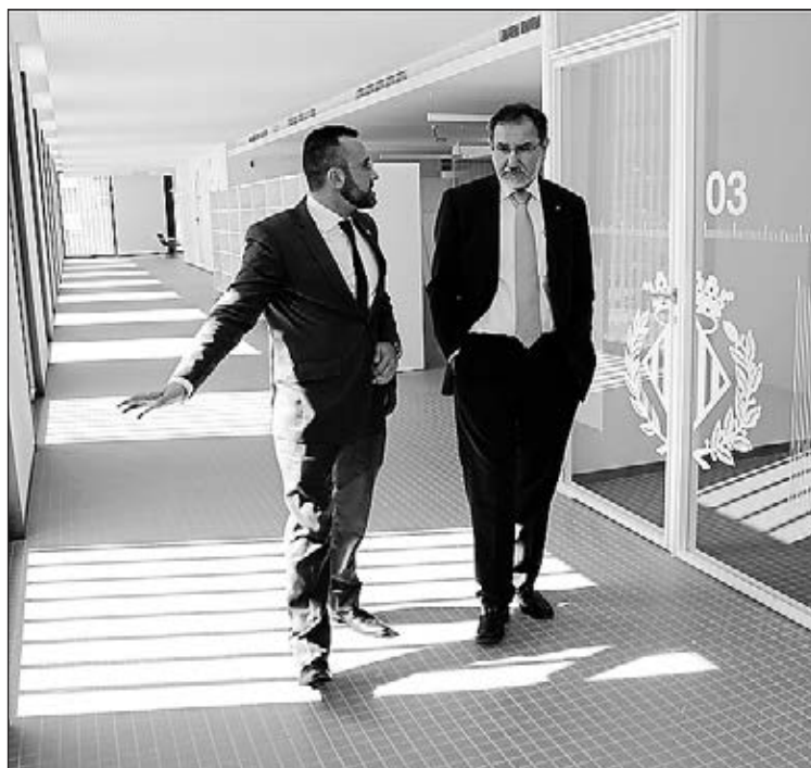
Després de la signatura es va fer una visita a les instal·lacions.

de les dificultats, qui sap si fins i tot poder tenir en un futur a Vila-real alguna titulació universitària de l'UJI", conclou Benlloch.