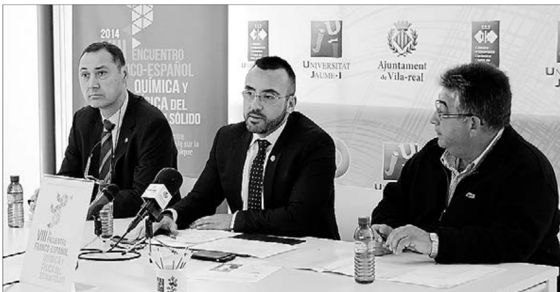
Imatge de la presentació de la VIII Trobada francoespanyola de la química i la física de l'estat sòlid.