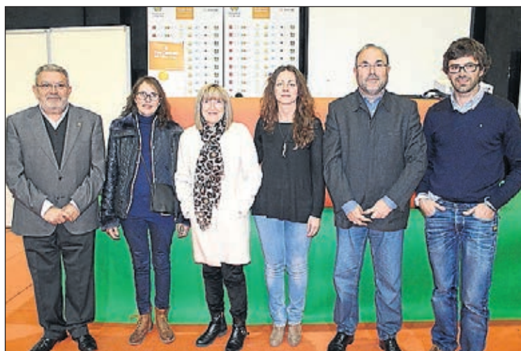
En el evento también se premió a la mejor mermelada de naranja.

El programa de la feria, organizado bajo el mando del joven agricultor innovador de Vila-