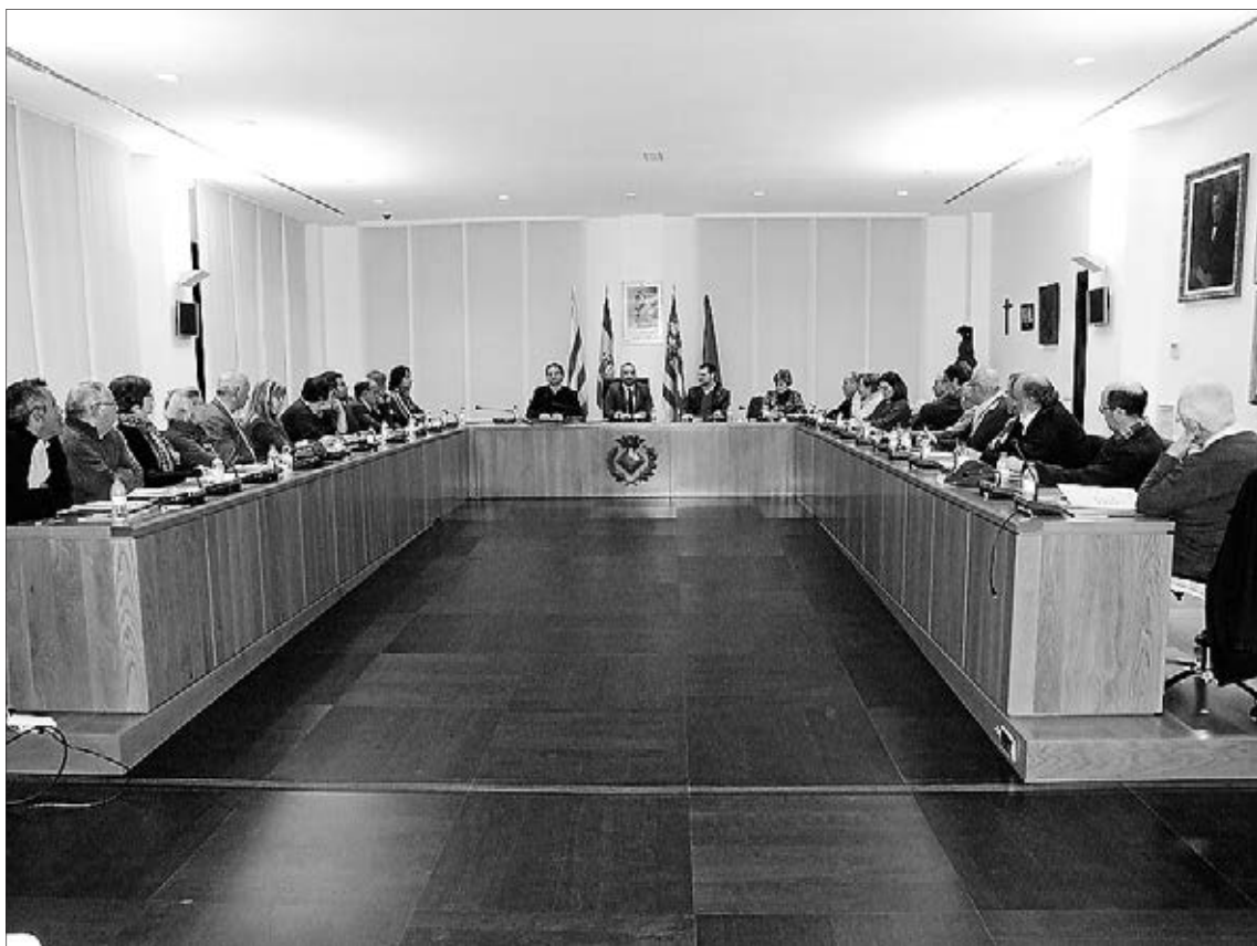
El diagnòstic es va presentar al març en un ple extraordinari del Consell de Participació Ciutadana.