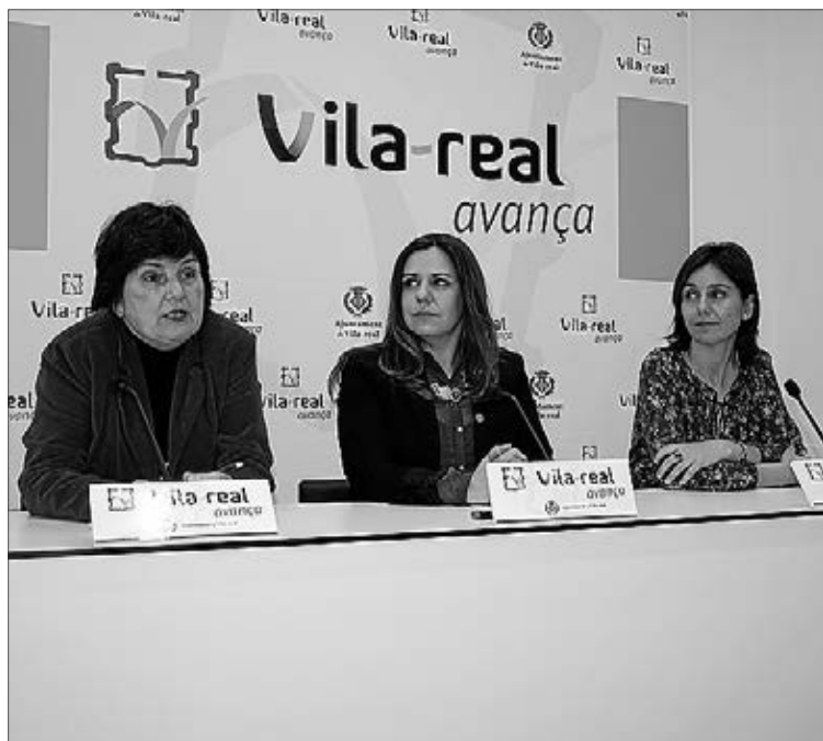
La regidora ha anunciat que la ciutat se sumará a la xarxa d'Isonomia.

La Unitat de Mediació de la Policia Local va culminar amb acord entre les parts el 90% dels casos tramitats el 2013. Aquesta és una de les principals dades que s'extrauen del balanç d'una unitat que s'ha convertit en un referent mundial en l'àmbit de la mediació com a via per a la resolució de conflictes. Al llarg de l'any, la Policia ha participat de forma activa en la resolució de 254 casos i en la seua majoria, 190 de l'actuacions ateses, pertanyen a reclamacions d'àmbit comunitari i rural.