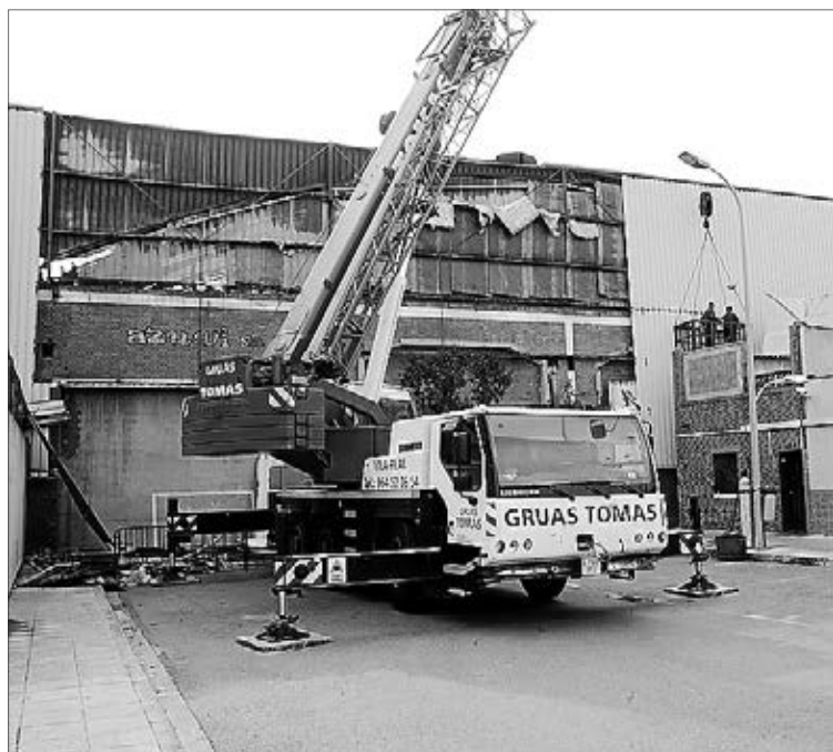
Una enorme grúa ha trabajado en la zona para derribar un muro.

mejora de la seguridad en el barrio, donde las viviendas y la fábrica han estado anexionadas durante décadas y donde, desde la inauguración de Vila-center ha comenzado a emerger la verdadera fisonomía de la barriada, donde todavía queda en pie una gran parte del recinto fabril, que está en manos de varios bancos, con quienes el Ayuntamiento se ha puesto en contacto últimamente para que se hagan cargo del desmantelamiento de las construcciones que todavía quedan en ruinas, por motivos de seguridad, ya que en los últimos años se han producido robos y accidentes, a pesar de estar precintadas. ≡