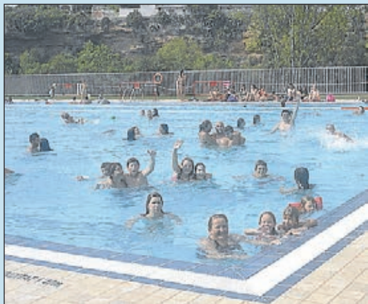
Infraestructures esportives a l'abast dels veïns.