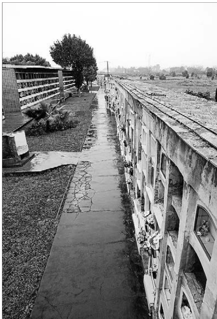
El objetivo es reparar el máximo perímetro posible del camposanto.

“A lo largo de estos años y, dentro del Plan de Mejora del Cementerio, hemos llevado a cabo diferentes actuaciones con el mínimo presupuesto, como ha sido reparar cubiertas o construir nuevos nichos, con el objetivo de ofrecer este servicio durante muchos años y no tener la necesidad de construir otro cementerio”, ha concluido la edila. ≡