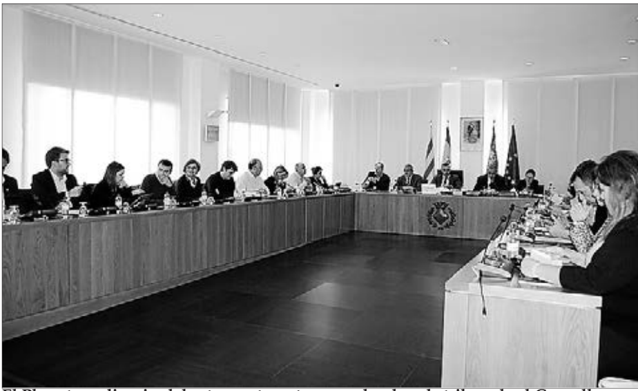
El Ple extraordinari celebrat recentment va acordar dur als tribunals el Consell.