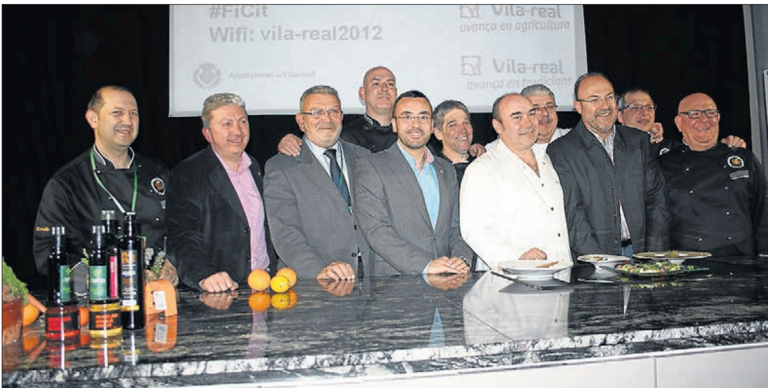
Una de las actividades más exitosas de la II Fira Citrícola fue la del 'showcooking' a cargo de reconocidos chefs en la Casa dels Mundina.