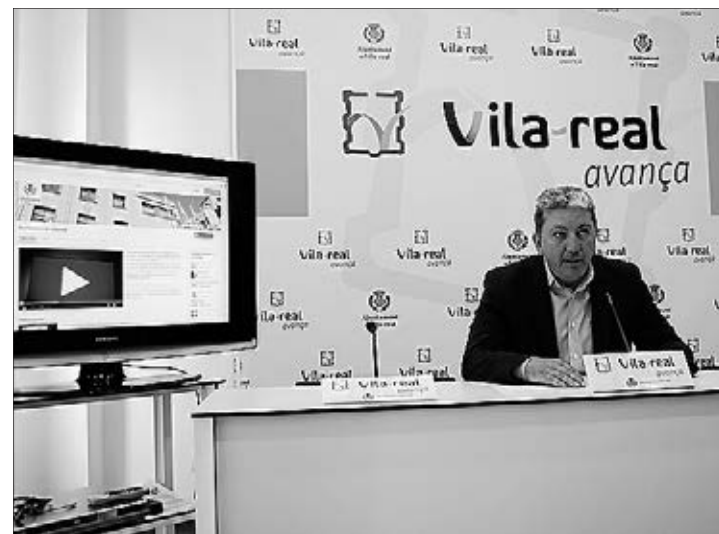
El regidor de Modernització ha presentat aquest nou servei.

han suposat el pas dels 15 indicadors de transparència que es complien el 2011 (17,5%) als 28 actuals (31,87%), ja siga amb caràcter total o parcial, del total de 80 indicadors ITA de transparència reconeguts en l'àmbit internacional. Aquestes xifres suposen un increment de 14,37 punts, dada que reflecteix "un increment substancial", afirma el primer edil. En aquest sentit, les conclusions de l'estudi de transparència recomanen l'elaboració d'un pla de transparència per fases, amb l'objectiu de seguir implementant millores que permeten arribar a un 50% del total d'indicadors. Per a això, l'informe inclou una bateria de propostes com la incorporació al portal web d'un apartat específic de transparència, la formació en aquesta matèria del personal municipal i responsables polítics o l'elaboració d'un codi de bon govern. ≡