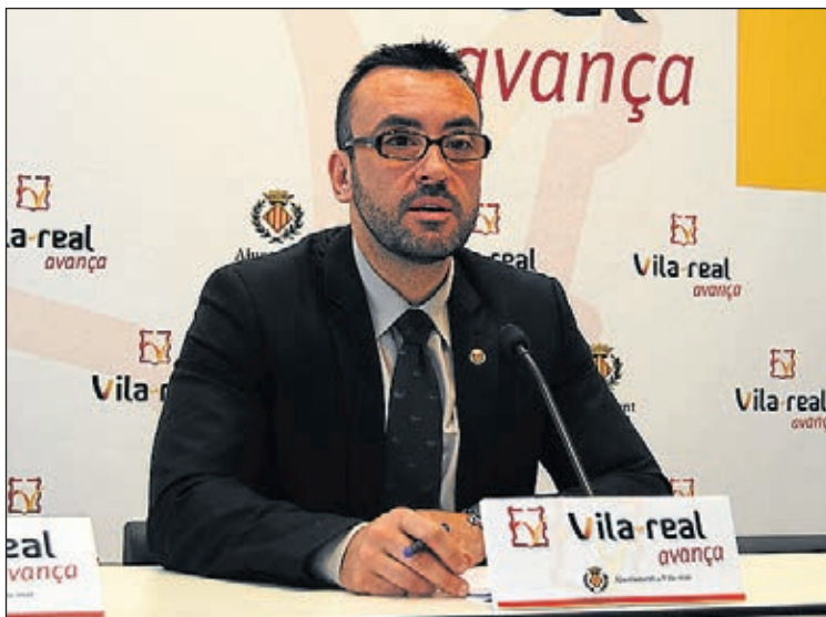
L'alcalde ha explicat que la ciutat ha tancat el 2013 amb romanents.

romanents està "compromesa" per a sufragar inversions previstes el 2013. "Es tracta d'obres com els horts socials, el carril bici, el circuit de 'running' de l'ermita o el sostre de l'aulari del Carles Sarthou, que suposaran una inversió d'1,8 milions d'euros", detalla "Fent un nou exercici de responsabilitat, reservarem una altra part important", afegeix, "d'1,7 milions, per a fer front a imprevistos que puguem arribar, com les sentències urbanístiques a les quals hem de fer front contínuament per l'empastre del PP". Altres tres milions es destinaran a despesa corrent de les diferents regidories per a cobrir les necessitats de l'any i intentar reduir el termini de pagament als proveïdors. ≡