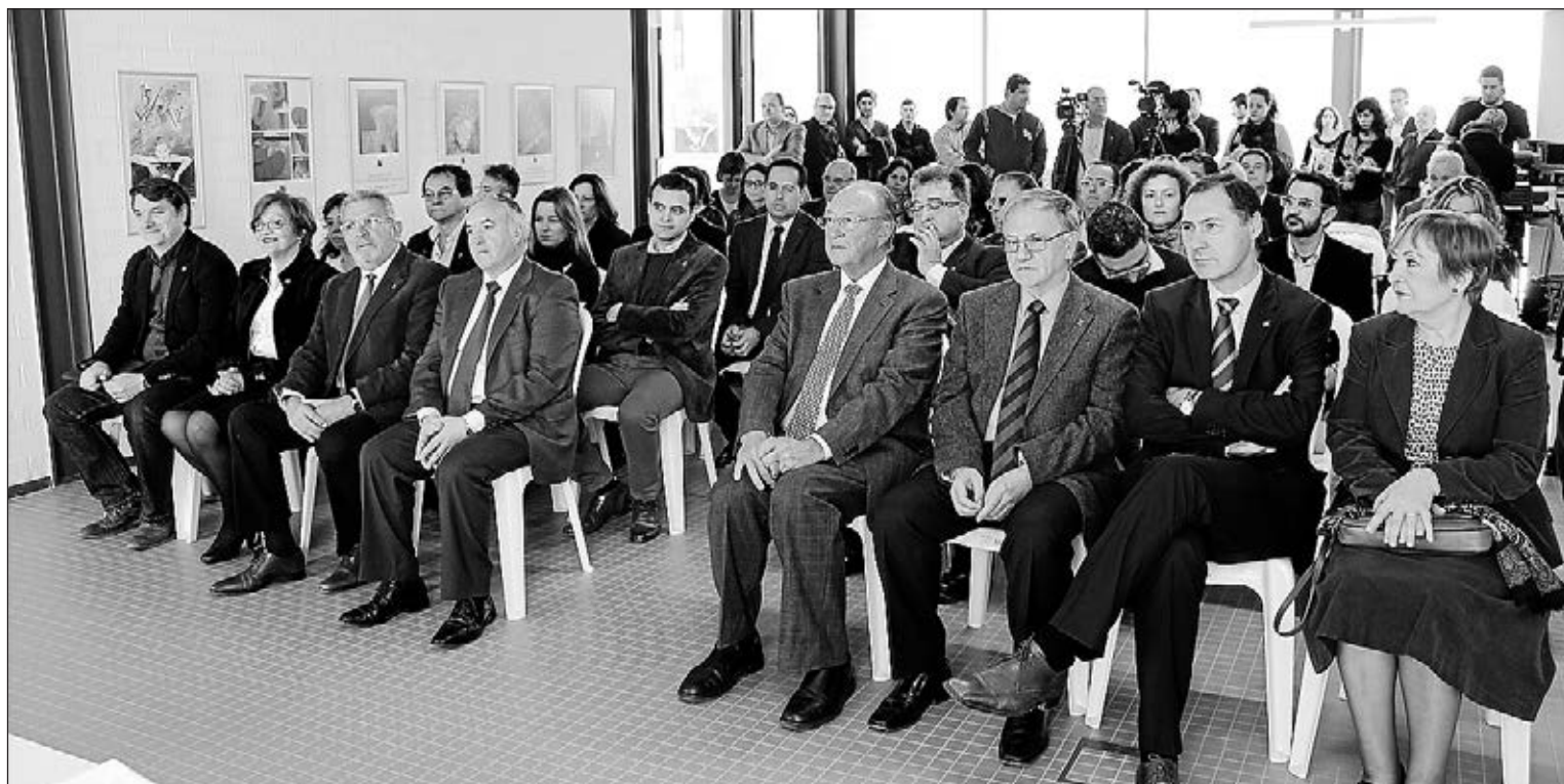
Imatge de la inauguració oficial de la seu universitària de la Plana a Vila-real, situada a la Biblioteca Universitària del Coneixement.

Amb aquesta finalitat, es crearà un consell assessor, amb àmplia representació social, una de les funcions del qual serà la de proposar activitats que permeten estreñer els llaços del programa d'extensió universitària amb la societat comarcal. "Hi haurà un abans i un després de la creació d'aquesta seu de la Plana. Estem encantats de poder comptar a Vila-real amb una seu universitària que ens permetrà estreñer els llaços i reforçar la col·laboració i, encara que sabem