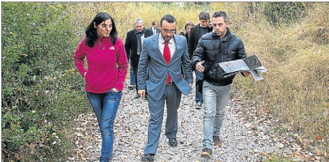
L'estalvi es destinarà a inversions com la Ciutat Esportiva o la platja del Millars, entre d'altres.