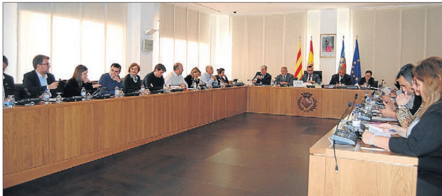
Estos resultados se han conseguido a pesar de haber bajado la contribución y de haber eliminado un año el impuesto de construcciones.

Se alcanza el objetivo de estabilidad presupuestaria, certificando que las cuentas están saneadas