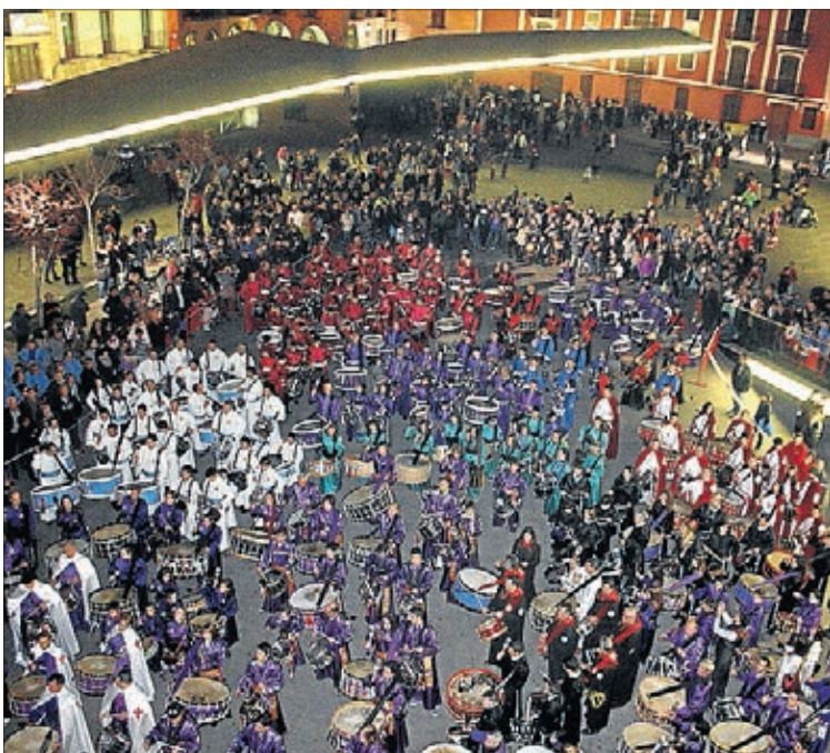
Vila-real ha acogido la IV Tamborrada provincial como preludeo.

→ MEDIO AMBIENTE. Un grupo de jóvenes del centro de reeducación de menores Pi Gros de Castellón ha participado en las tareas de señalización de las especies vegetales presentes en el paraje del Ternet. La actividad, impulsada por la Concejalía de Sostenibilidad y enmarcada en el primer programa de voluntariado ambiental ha consistido en crear los paneles y colocarlos.