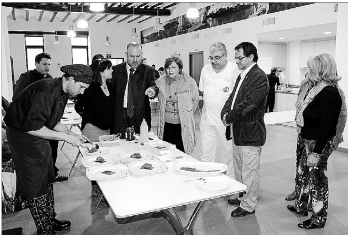
El jurado profesional se ha reunido en la Casa Social de las Amas de Casa para evaluar a los aspirantes.