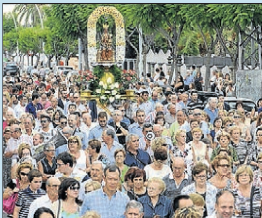
Riquesa cultural, fervor i tradicions pròpies.